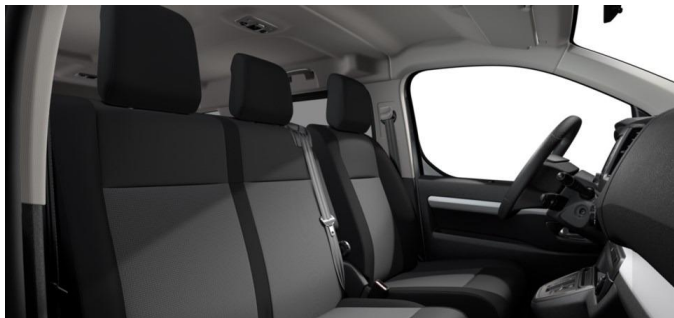
STOFF CURITIBA TRITON