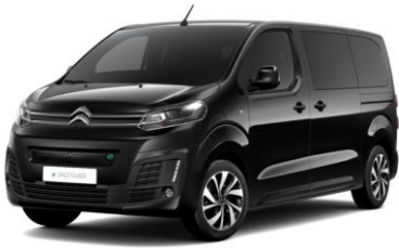
PERLA NERA-SCHWARZ (M)